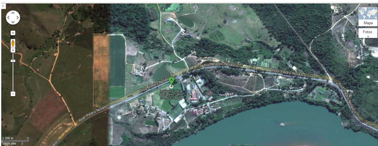
Figura 01: Vista aérea do IFES Campus Itapina

O IFES Campus Itapina está localizado na Rodovia Br 259, km 70, caixa postal 256, Distrito de Itapina, Colatina-ES, CEP: 29709-910. O conjunto arquitetônico do Campus é constituído atualmente por 134 imóveis totalizando uma área construída de 29.344,90 m 2 e 16.733,00 m 2 de campo e quadras, distribuídos em núcleos e setores numa área rural de 2.959.108,726 m 2 , aproximadamente 61 alqueires.